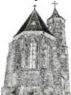
Parafia Ewangelicko-Augsburska w Lubaniu The Evangelical-Lutheran Parish in Lubań Die Evangelisch-Lutherische Kirchengemeinde in Lubań

Współorganizator Co-Organizer Mitveranstalter