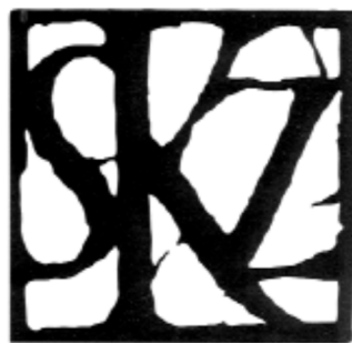
Oddział Dolnośląski Stowarzyszenia Konserwatorów Zabytków Lower Silesian branch of Association of Monument Conservators Niederschlesische Filiale der Verein der Denkmalschützer in Polen

Współorganizator Co-Organizer Mitveranstalter