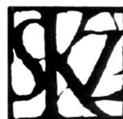
Oddział Dolnośląski Stowarzyszenia Konserwatorów Zabytków