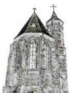
Parafia Ewangelicko-Augsburska w Lubaniu